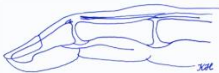
Mallet finger met peesletsel